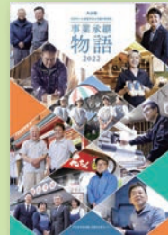
「事業承継物語2022」 (令和4年1月発行)