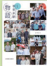
「事業承継物語201」 (令和3年1月発行)