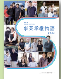
「事業承継物語2023」 (令和4年12月発行)

大分県事業承継・引継ぎ支援センターで支援した事業者(親族内承継、第三者承継)の事例をまとめた小冊子です。電子版(PDF)は、当センターホームページからダウンロードしてご覧いただけます。