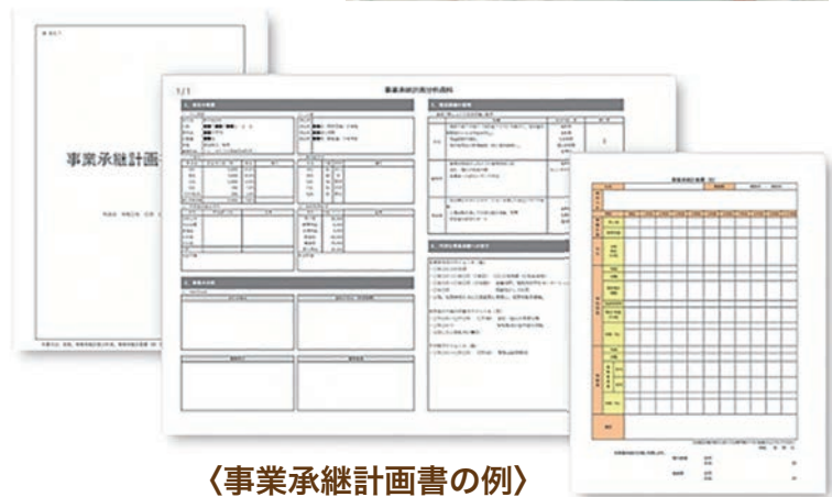
〈事業承継計画書の例〉

当センターの登録専門家（税理士、弁護士、中小企業診断士等）と連携して、事業承継にあたっての課題を整理し、経営者・後継者（候補）と一緒に解決策を検討します。事業承継計画書の策定を通して、事業承継の実現から事業承継後の取り組みまで、円滑な事業承継を実現するための具体的な道筋を明確化する支援を行います。（無料、回数制限あり）